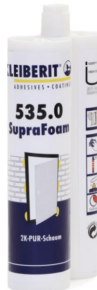
SupraFoam DZ vo dvojitej kartuši