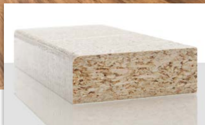
2. Die Schmelzmassen KLEIBERIT 762.3 oder KLEIBERIT 755.0 ermöglichen eine exzellente Verfüllung der Mittelschicht.