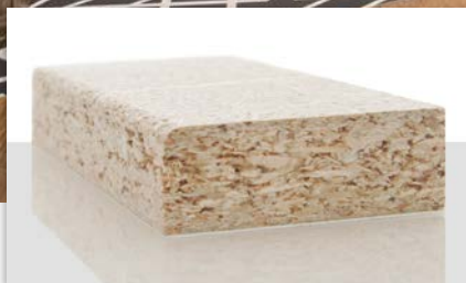
1. Eine grobstrukturierte Mittelschicht lässt die Ummantelung einer Spanplattenkante mit dünnen Papierfolien nicht zu.