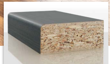
3. Das fertige Produkt: Kante und Oberfläche sehen exakt gleich aus.

Das Verdichten und Glätten der Kanten von Spanplatten ist ein lange bestehender Wunsch der Möbel- und Innenausbauindustrie. Durch das Verfüllen der groben Mittelschicht und entsprechendes Glätten, können profilierte Spanplatten auch mit sehr dünnen Papierfolien kaschiert bzw. ummantelt werden, ohne, dass die Gefahr des Durchtelegrafierens besteht. Der Einsatz von homogenen, aber wesentlich kostenintensiveren Werkstoffen (z.B. MDF), kann eingespart werden.