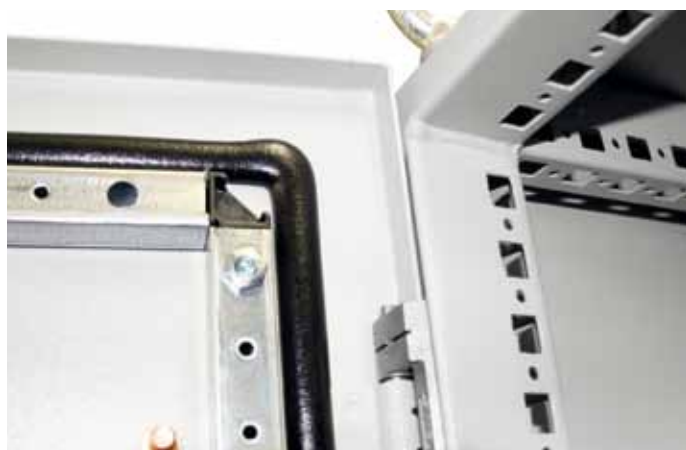
Dichtungsschaum für einen elektronischen Schaltschrank