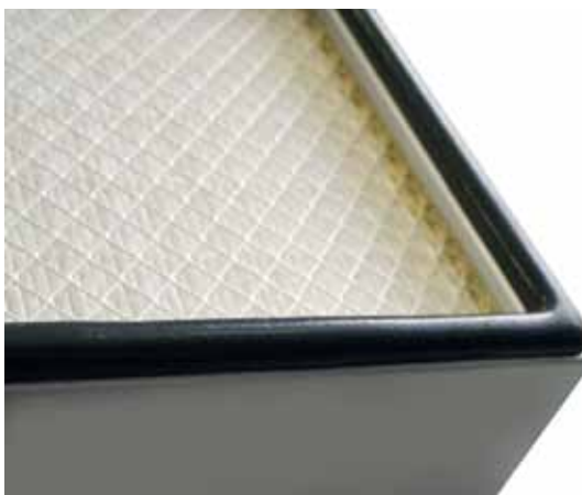
Dichtungsschaum für Filter