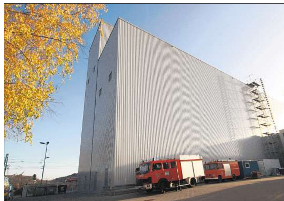
DAS NEUE HOCHREGALLAGER der Weingartener Firma Kleiberit, die am Standort in mehrere Maßnahmen zwölf Millionen Euro investierte. Kleiberit produziert unter anderem Klebstoffe.

Rund drei Viertel der Klebstoff-Produktion gehen in den Export.