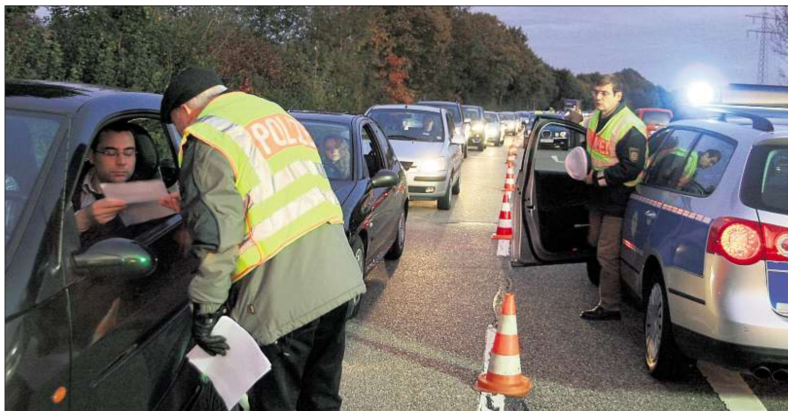
KONTROLLE: Mit großem Personaleinsatz fahndete die Polizei bislang nach dem Verursacher des tödlichen Verkehrsunfalls Mitte Oktober auf der B 293 bei Wössingen – bislang allerdings vergeblich.

Der Start der Ermittlungen war aufwendig. Zwei Abende lang wurden Autofahrer auf der B 293 befragt, in den Tagen danach gab es mit Hilfe von etwa 100 Beamten der Bereitschafts-